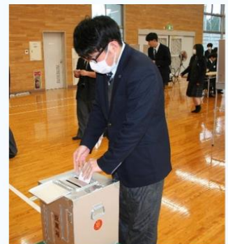
模擬投票をする2学年の生徒

本講座は、南三陸町の選挙管理担当の方、そして南三陸高校社会科の先生方が実務担当として進められました。