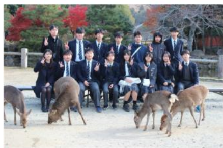
鹿と一緒に奈良公園で記念撮影／2-1