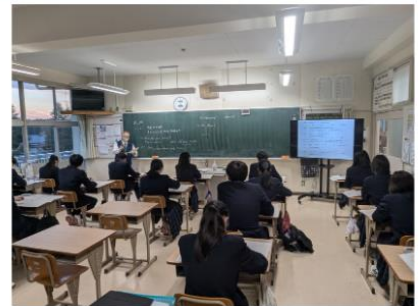
入試対策講座・英語／歌津中学校