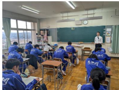
入試対策講座・理科／志津川中学校