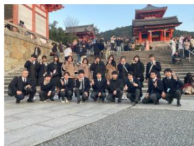
人気の清水寺にて／2-3