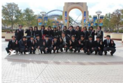
いよいよメインイベント USJ入り口にて／2-2