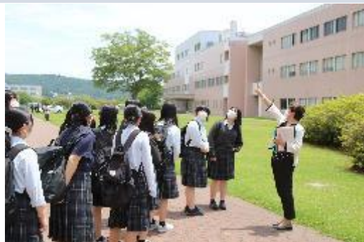
〈広大な石巻専修大学キャンパスにて〉

今回の大学見学会は、進学希望の有無を問わず、自分と進路について考える良い機会・成長の機会になったことと思います。