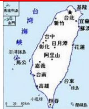
【嘉義市は中央南部に位置】

7月18日(火) 台湾から、国立嘉義高級中学の生徒、教職員の方々、そして随行員の皆様、総勢二十数名をお迎えしました。国立嘉義高級中学は台湾の中央南部に位置する嘉義市の国立高等学校です。卒業生は台湾の政財界など様々な分野で活躍しており、最も有名な伝統校のひとつです。