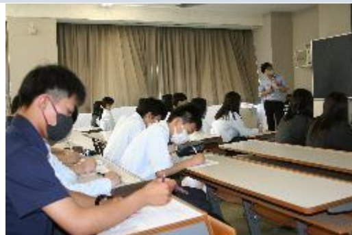
〈模擬授業の様子/文化人類学への誘い〉