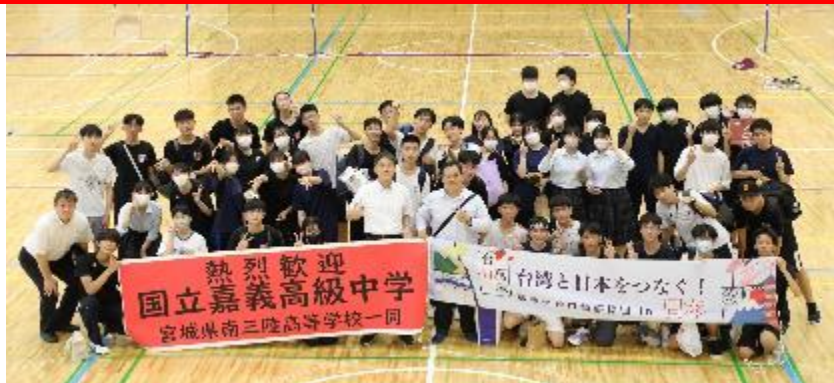
【嘉義国立高級中学、南三陸高校生徒・職員で記念写真撮影】